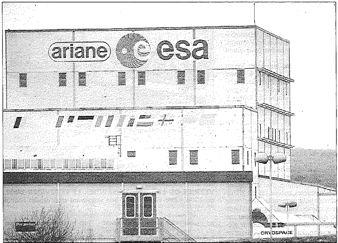
Cryospace air liquide, membre du groupement d'intérêts économiques d'EADS, a mis plusieurs années avant de s'apercevoir qu'une de ses salariées lui volait de l'argent.